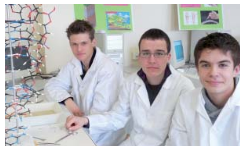
Les secondes présentaient les options proposées par le lycée (LV3 italien, allemand, théâtre, arts plastiques, MPI, IGC) ainsi que leurs travaux réalisés en cours, puis répondaient aux éventuelles questions des visiteurs.