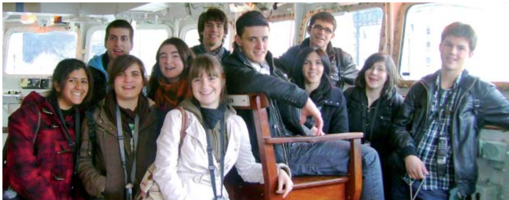
Dans le poste de pilotage du ferry, les élèves de la section européenne sont aux premières loges pour apercevoir les rives anglaises.

Il y a deux ans, le lycée du Roc a ouvert une section européenne option anglais. Quelle est donc cette discipline relativement récente dans l'établissement ?