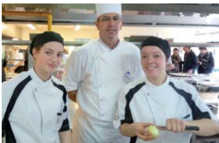
Éplucher une pomme de terre, un travail basique qui peut conduire aux plus grands restaurants. Les professeurs sont heureux de voir que leurs élèves font preuve d'une réelle motivation pour la formation qu'ils ont choisie.