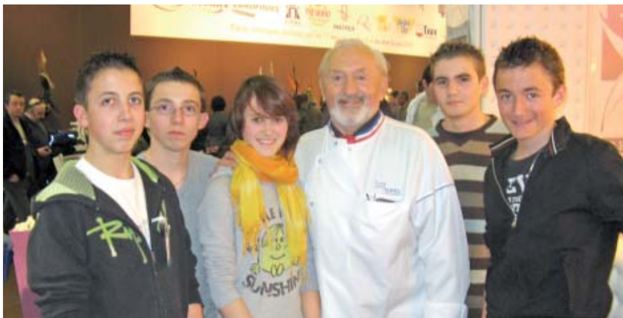
Les élèves n'ont pas manqué une tranche de cette sortie parisienne. Ici, en compagnie d'Yves Thuriès, grand maître pâtissier devant l'Éternel.

Les 9 et 10 mars, la classe de seconde Boulangerie-pâtisserie s'est levée aux aurores (4 h du matin!) Direction Paris, afin de visiter le salon « Européen » et le marché de Rungis. Dans le cadre d'un projet pédagogique portant sur le pain et ses différentes méthodes de fabrication, les élèves ont organisé leur voyage de A à Z, pris contact avec la société de transport, expédié les courriers aux parents, évalué le budget, etc. Motivation et sens de l'initiative étaient donc requis!