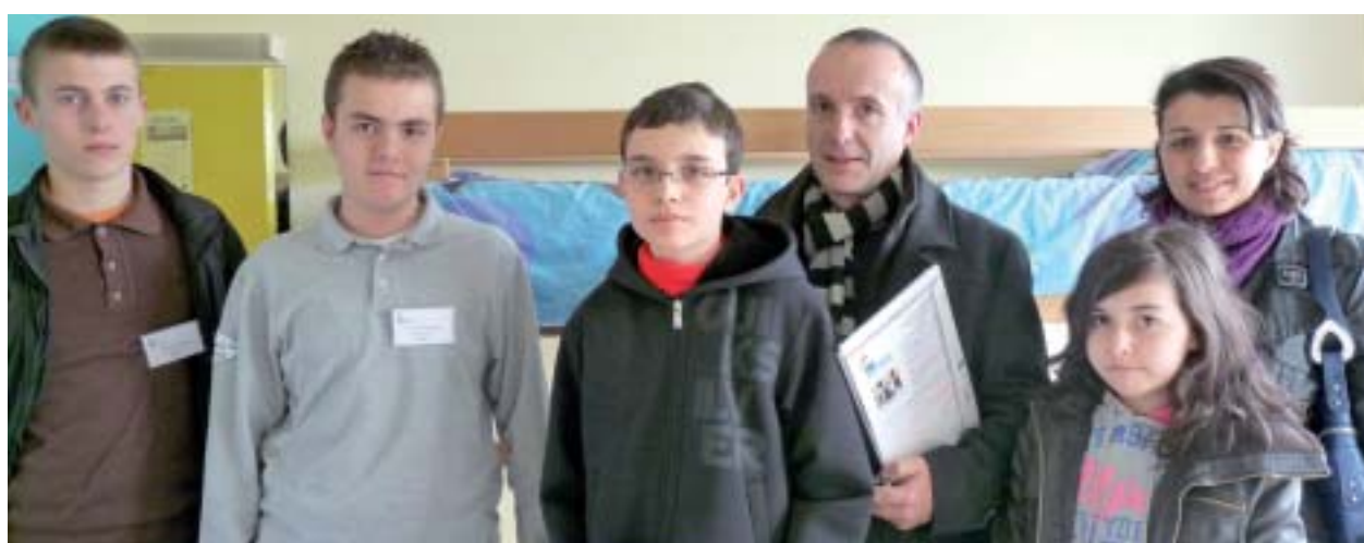
Les familles, guidées par des élèves, pouvaient visiter tous les locaux de l'établissement : salles de classes, gymnase, self, ainsi que les dortoirs de l'internat. Au Roc, les internes bénéficient d'activités extra-scolaires.