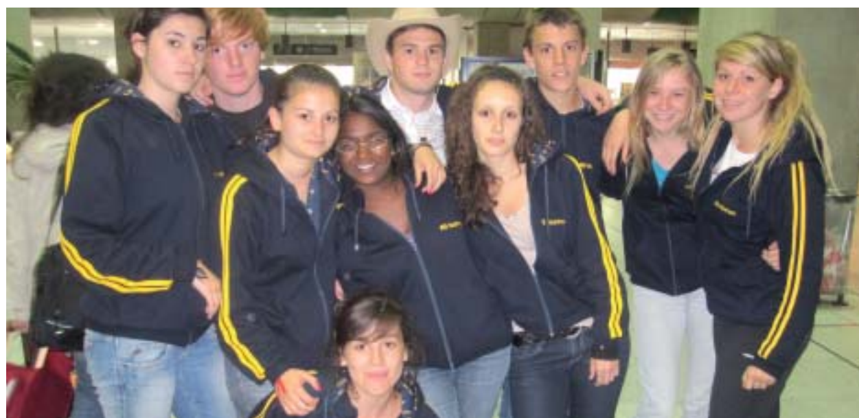
Les jeunes du Roc n'étaient pas mécontents de rejoindre Rossy, malgré un supplément de trois jours au Brésil.

Rubrique réalisée par Alexis DAUTRICHE, première 1L.