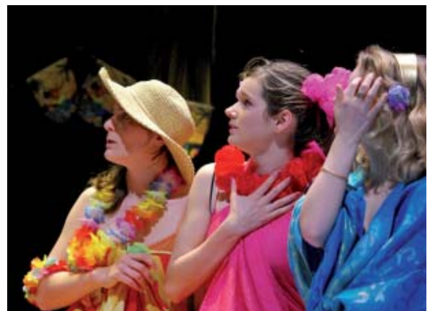
Les élèves de théâtre en représentation lors de « Roc en scène » 2009.

Mardi 18 mai, le spectacle annuel du lycée : « Roc en scène » sera de retour à l'IST pour la plus grande joie de ses participants. Malgré un début difficile et une représentation compromise, la commission culturelle a repris les rênes de « Roc en scène » et permis aux élèves participants de mener à bien leur projet. Ce qui leur permettra de mettre en valeur leur travail. Au programme, une cinquantaine d'élèves motivés nous proposent de la danse hip-hop, du théâtre et du cirque. Chaque discipline est encadrée par des professionnels et des professeurs. Cédric Malo-