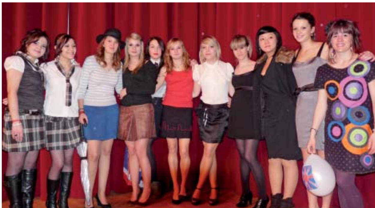
Le défilé des sections Métiers de la mode-vêtements, qui a fait la renommée de la filière au sein du lycée comme à l'extérieur, était proposé à deux reprises. Une prestation de grande qualité qui a réjoui tous les invités.

La journée « portes ouvertes » du Roc s'est déroulée le samedi 13 mars de 9 h à 17 h. Une réussite, comme les autres années. De nombreux visiteurs ont été accueillis par les secondes, qui étaient réquisitionnés comme guides.