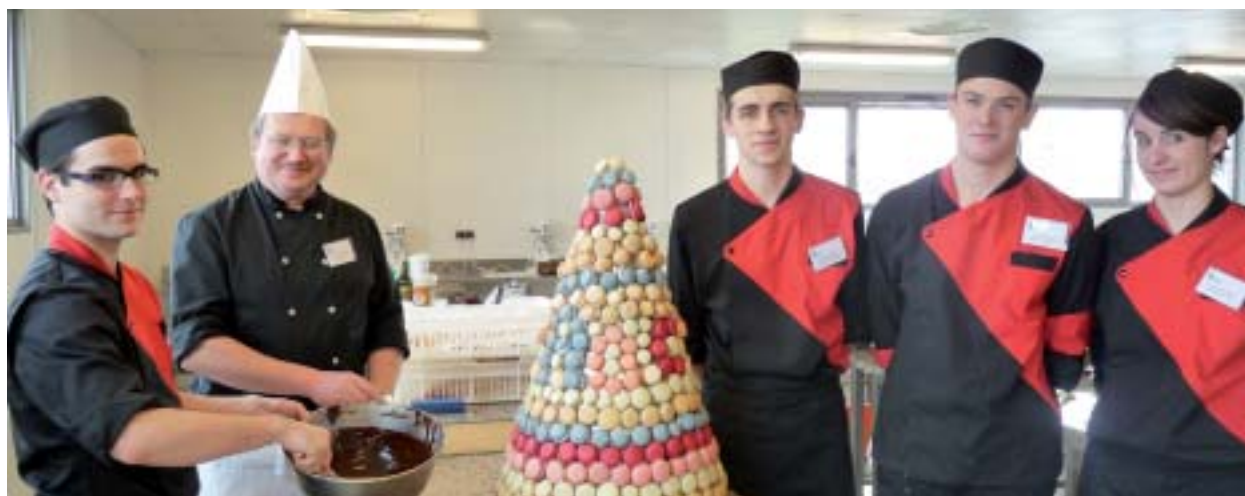
Cette pièce montée réalisée par des élèves de la section Pâtisserie des Sorbets témoigne de leur savoir-faire acquis, et des exigences demandées par les enseignants du lycée hôtelier : rigueur, motivation et régularité.