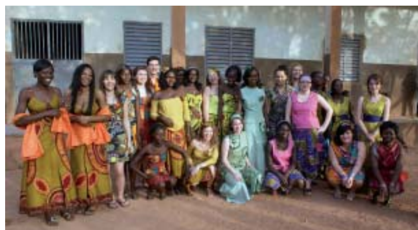
Entre élèves de l'école de couture de Ouagadougou et jeunes de la section Métiers de la mode du Roc, de grands moments de fraternité.

compagné d'une initiation aux machines à coudre à pédales (comme celle de nos grands-mères! ndr), et aux fers à braises, bien loin de nos modernes fers à vapeur! », souligne Caroline. Autre plongée dans l'ambiance locale, la négociation et l'achat des tissus nécessaires sur le grand marché de Ouagadougou. Aboutissement: la présentation de la collection, lors du défilé organisé par Emma et Solange, clou d'une fête où l'on a pu voir des collégiens présenter des costumes traditionnels et des