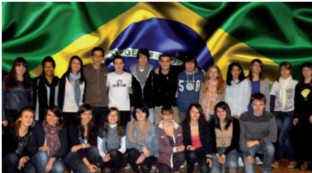
Le groupe des 25 sur le départ. Objectif Rio, le Corcovado et tant d'autres lieux mythiques, jusque-là demeurés à l'état de photos dans les bouquins de géo.

Passage à l'hôtel, toilette, puis petite promenade sur le Corcovado pour se