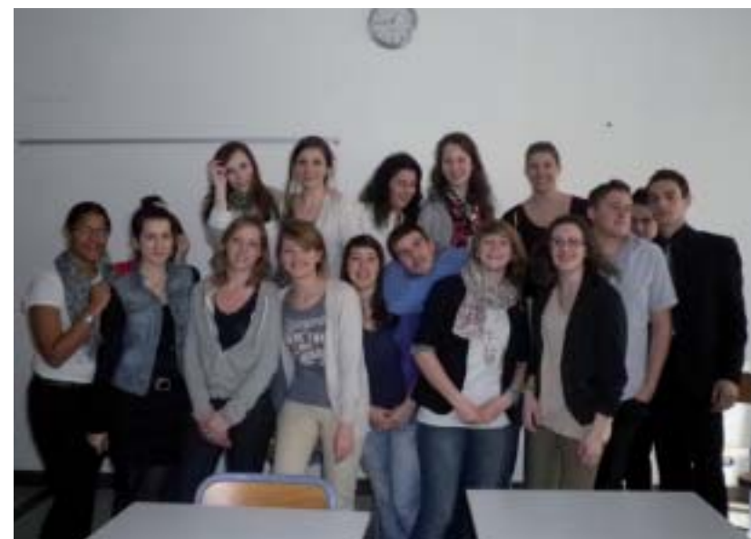
La grande équipe du comité organisateur après une réunion fructueuse, malgré quelques absents.