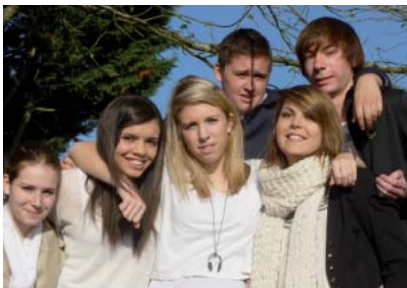
Des terminales prêts à larguer les amarres pour mettre le cap sur la vie, après trois années au Roc dont ils garderont le souvenir.

Je n'ai pas eu un meilleur moment mais plusieurs ! Ce qui m'a paru le mieux au long de ces trois années, ce sont les rencontres. De la seconde à la terminale, j'ai fait la connaissance de personnes géniales, et c'est surtout grâce à elles que j'ai passé de merveilleux moments au lycée. Je n'aurais jamais cru dire ça quand je suis arrivée en seconde, mais l'ambiance, les fous rires en cours, au self... vont sûrement me manquer. Ces années étaient vraiment parfaites et resteront de très bons souvenirs.