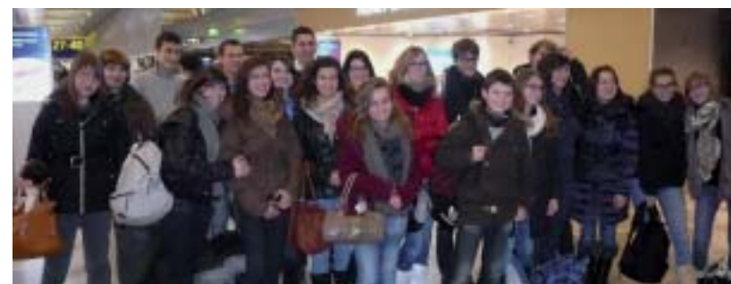
Le voyage en Finlande? Une expérience qui marquera ceux qui y ont participé.

Du 7 au 15 février, un petit groupe d'élèves du lycée Notre-Dame-du-Roc a vécu au rythme des Finlandais, à l'occasion d'un voyage pédagogique.